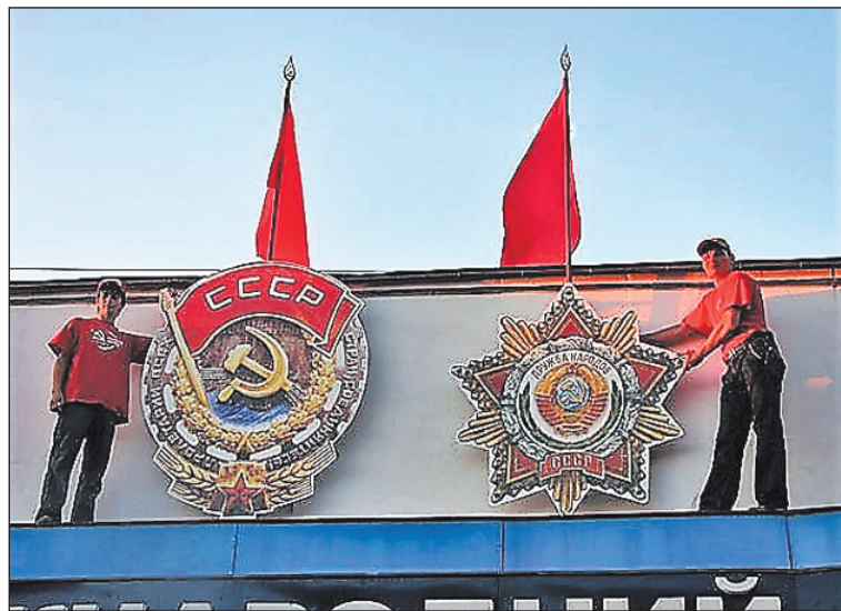
Традициям СССР верны! «Артек» возвращен детям