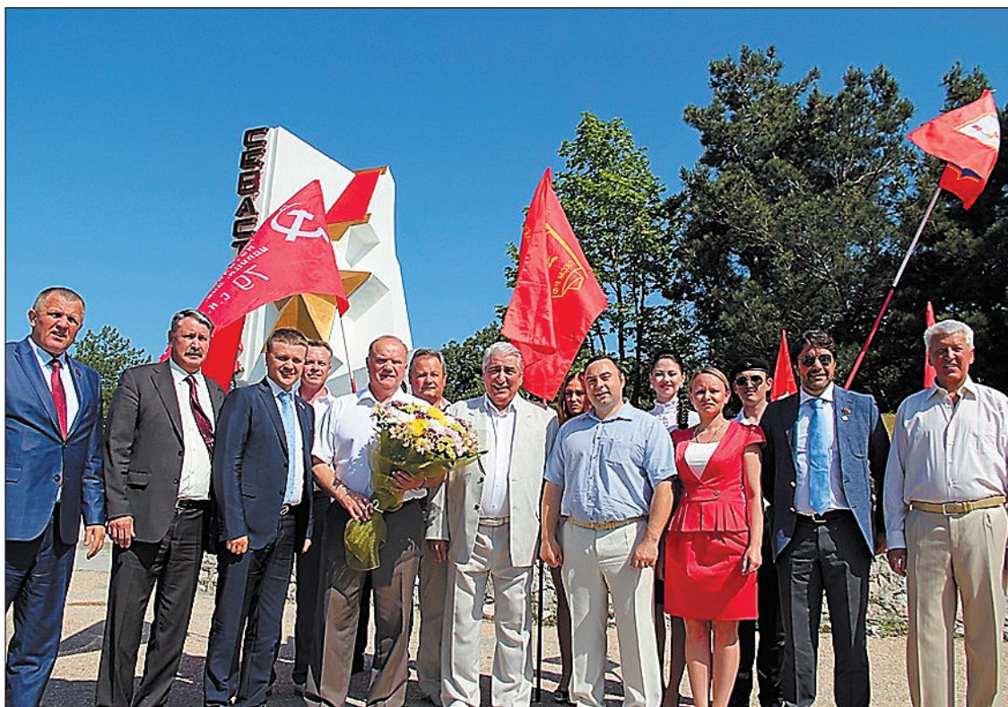
Закладка памятника основателю Новороссии – князю Григорию Потемкину-Таврическому

«Крымчане показали удивительный пример для всех нас. И мы должны извлечь из этого далеко идущие уроки.