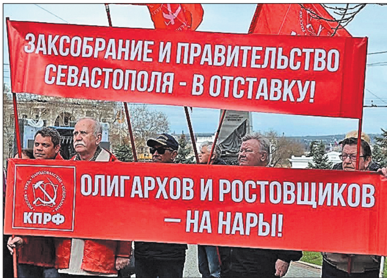
Митинг в Севастополе против обнищания, бесконечных кредитов, растущих цен на продукты и ЖКХ