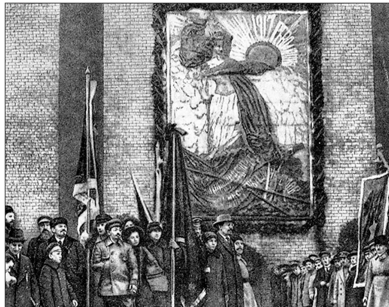
В.И. Ленин и Я.М. Свердлов 25 октября 1918 года на открытии мемориальной доски «Павшим в борьбе за мир и братство народов» на Сенатской башне Кремля. Скульптор Сергей Коненков

Магазины были тоже закрыты, и представители имущих классов