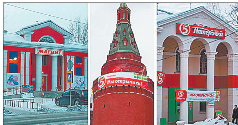
Магазины захватывают Россию.

Во время ремонта жители дома терпели неудобства — выбивало электричество, по стенам пошли трещины, а о тишине можно было только мечтать! В ответ на это собственник пригрозил, что, если ему не дадут открыть магазин, он откроет общежитие, и тогда жильцы точно по-