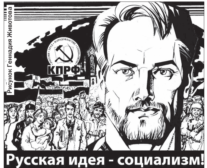
Рисунок Геннадия Животова