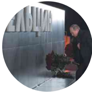
V.V. Путин возлагает цветы к мемориалу Б.Н. Ельцина

Кстати, создание Ельцин-центра стоило российскому