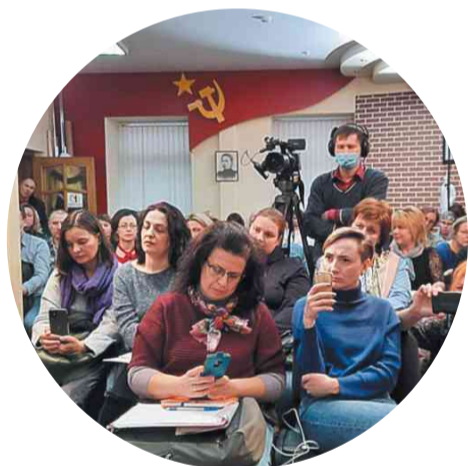
Представители Советов родителей на встрече с депутатами от КПРФ

Коммунисты ясно видят опасность. Здесь будет уместно процитировать первого секретаря Московской городской организации КПРФ, депутата Государственной Думы В.Ф. Рашкина: «Эксперимент с введением дистанта, я в этом убежден, позволит в дальнейшем перейти во всей стране на дистанционную систему образования во всех школах всех регионов, сел и поселков с последующим уничтожением школ как зданий и учреждений и застройкой этих площадей коммерческим жильем, как это произошло с больницами и поликлиниками, которые реформировали за 10 лет, и половина больниц и поликлиник была закрыта и уничтожена, а потом их территорию застроили под коммерческое жильё».