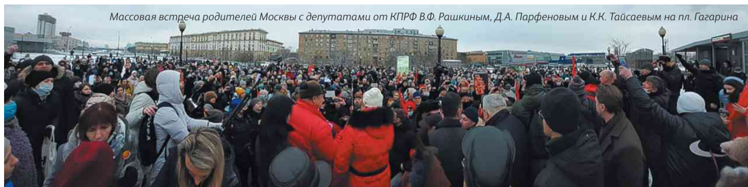
Массовая встреча родителей Москвы с депутатами от КПРФ В.Ф. Рашкиным, Д.А. Парфеновым и К.К. Тайсаевым на пл. Гагарина