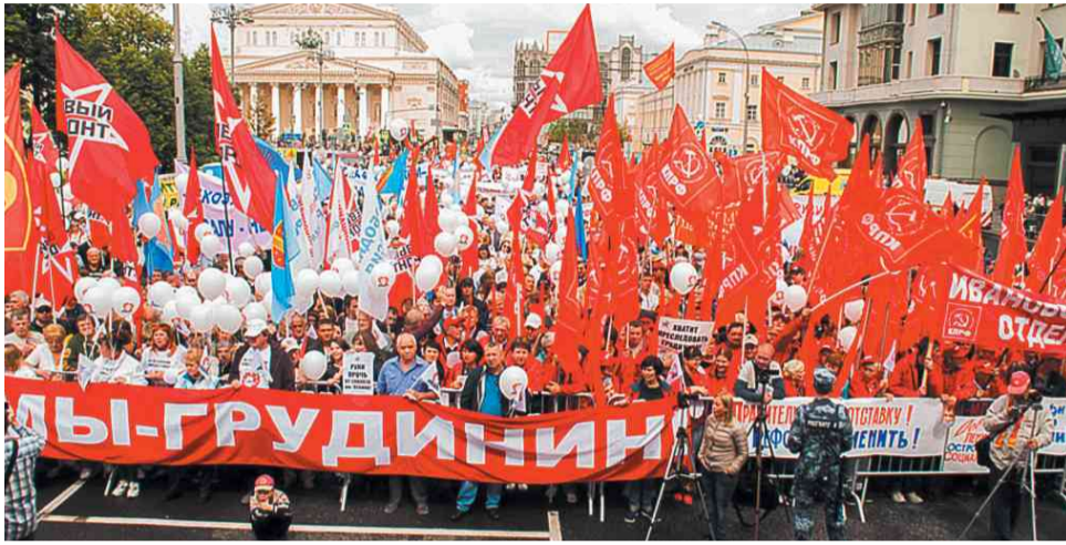
Митинг КПРФ на Театральной площади в защиту Павла Грудинина

Первыми под удар попадают «красные» губернаторы. Более 300 грязных репортажей вышло в том числе и на центральном телевидении против бывшего губернатора Иркутской области Сергея Левченко. Информационные атаки организуются по