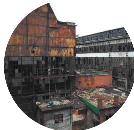
На месте знаменитого ЗИЛа построен очередной жилой комплекс

А советский уровень развития экономики для буржуазной России недостижим, поэтому он табу, его не принято цитировать, соотносить с ним буржуазные «успехи», ибо в этом случае может случиться конфуз.