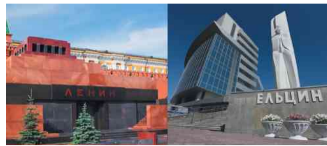
МАВЗОЛЕЙ ЛЕНИНА: Стоимость содержания – 17 млн рублей в год

Это просто скопище всех возможных либеральных мифов, этакое «Зазеркалье», где добро называют злом, а зло рядом в тогу добра. Его экспозиции очерняют тысячелетнюю историю России, особенно советский период. Чего стоит только видеоролик, где тысячелетняя история России и СССР предстает грязной, полной лжи и предательства, а