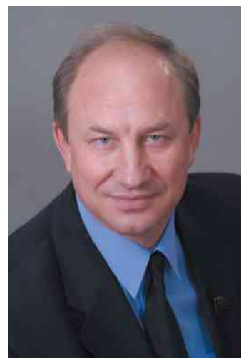
В.Ф. Рашкин, Первый секретарь Московского городского Комитета КПРФ, депутат Государственной Думы

«Даже люди, которых трудно заподозрить в симпатии к левым идеям, вынуждены согласиться – КПРФ была и остается самой сильной оппозиционной партией. У коммунистов есть огромное количество сторонников и активистов, причем не только в крупных городах, но и по всей стране. В каждом из городов именно коммунисты борются за права народа, отстаивая их как в парламенте, так и в полевых условиях – на митингах и пикетах. В отличие от прочих псевдо-оппозиционных партий, которые становятся оппозицией лишь перед выборами, а на думских сессиях смотрят в рот «единороссам», КПРФ последовательно ведет борьбу и голосует против всех антинародных законов.»