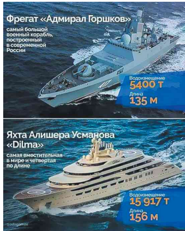
Фрегат «Адмирал Горшков»

Естественно возникает вопрос: ну хоть чем-нибудь выдающимся готов олигархат удивить народ, если не может порадовать