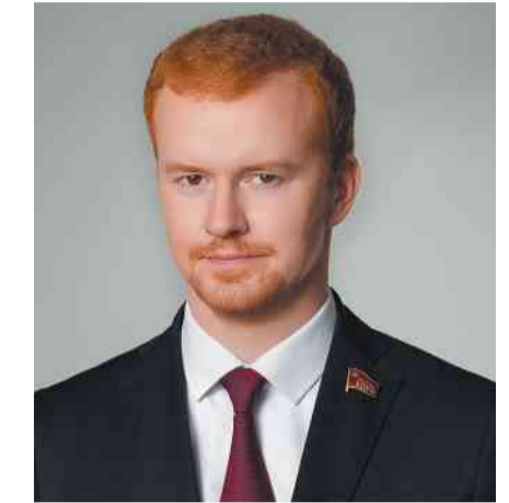
Д.А. Парфенов, Секретарь Московского городского Комитета КПРФ, депутат Государственной Думы

Задача КПРФ – за короткий срок изменить жизнь простых россиян в лучшую сторону, вывести страну из тупика, в который её вогнали. Для этого у нас есть всё: программа, опыт, политическая воля. Осталось главное – убедить людей поддержать социалистическое возрождение страны.»