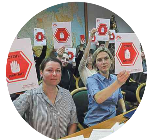
Родители на слушаниях в Госдуме держат плакаты «СТОП дистант»

Большую роль в борьбе сыграла самоорганизация граждан. То, что начали формироваться Советы родителей в районах, при школах, то, что Советы стали способом объединения и борьбы граждан за свои права – это важный задел на будущее. В своё