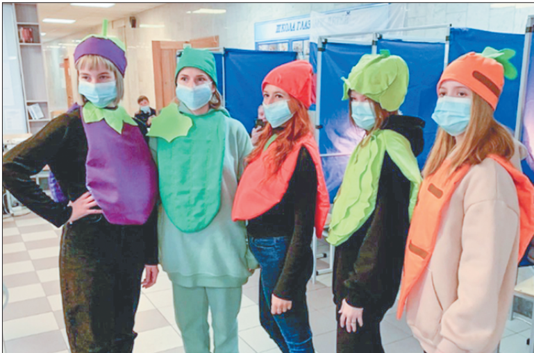
Ну-ка, фрукты, встаньте в ряд: вот какой электорат!