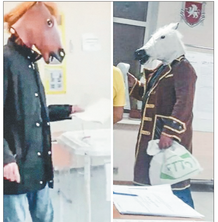
Ну а куда же без лихого коня? Их пришло даже два, на любой вкус. И оба – в пальто!