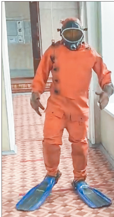
А этот отважный водолаз, по видимому, тонко намекает, что выборы – то ещё дно.

Выборы – это не только фальсификации, но иногда ещё и повод посмеяться. Публикуем подборку фото тех, кто перепутал выборы с детским утренником.