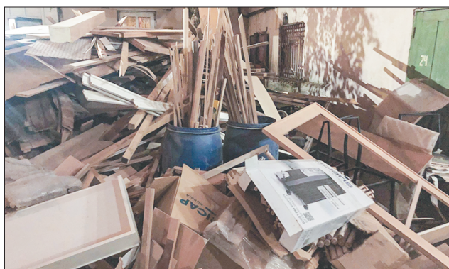
Стр 3 – Рейдеры захватили мебельную фабрику в Нагорном районе