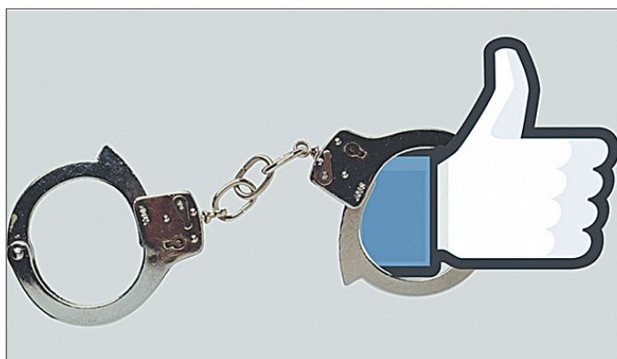
Стр 2 – Штрафы за репост