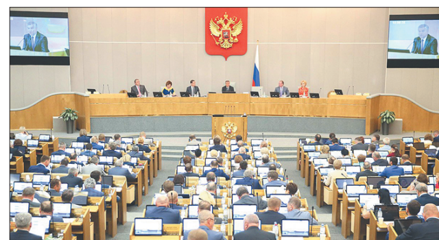
Стр 4 – Госдума приняла бюджет деградации страны