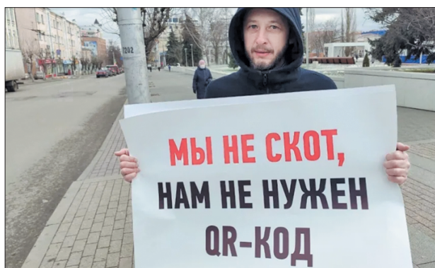
Стр 4 – Восстание QРепостных