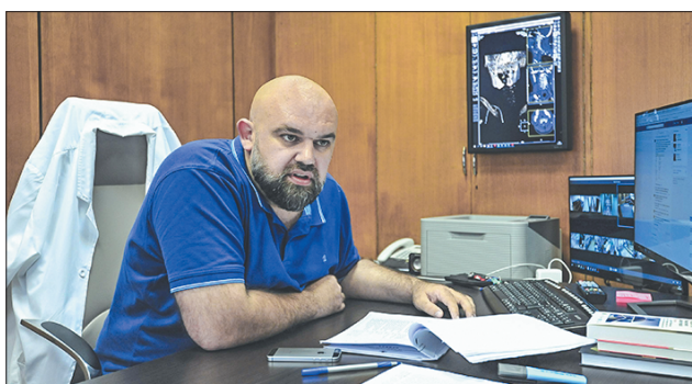
Стр 3 – Мы не против вакцинации, мы против принуждения