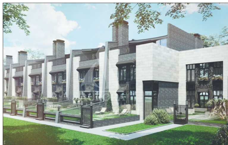
Улица Ефремова, дом 9 а, станет.

Продолжаем дивиться чудесам, которые нам преподносят строительные мафиози и вороватые чиновники и переходим к первому открытому в Москве в 1923 году дому детского творчества, который раньше находился по адресу: ул. Савельева, д. 5. Сейчас это здание занимает прединверсарий Сеченовского университета. Университет активно работает не