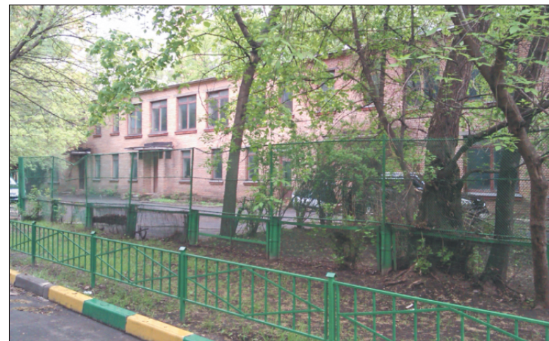
Улица Ефремова, дом 9 а, было.

Много чудес случается в Хамовниках, например и с Детской