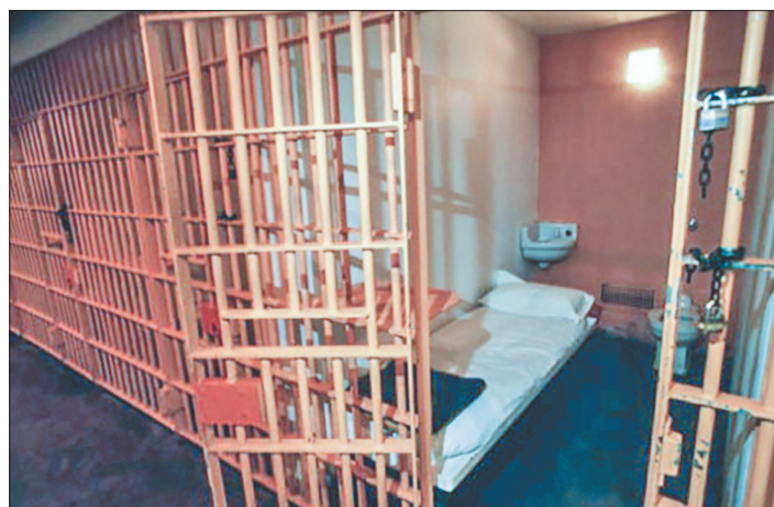
Стр 4 – Репрессивный эпизод