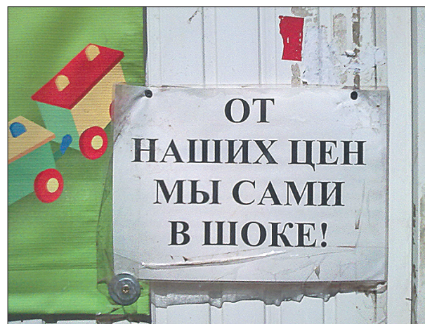
Стр 8 – Прогнозы и угрозы