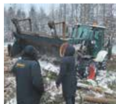
СПАСЁМ БИТЦЕВСКИЙ ЛЕС с. 4