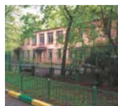
ЧУДЕСА СТРОИТЕЛЬНОЙ МАФИИ В ХАМОВНИКАХ с. 7