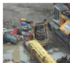
ЭЛЕКТРОННАЯ ДЕМОКРАТИЯ с. 6