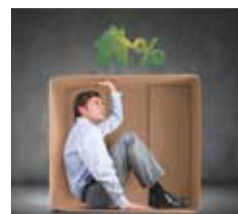
ИПОТЕКА: ВЧЕРА, СЕГОДНЯ, ЗАВТРА с. 5