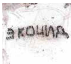
БИТВА ЗА ТРОИЦКИЙ ЛЕС с. 4