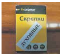
«СКРЕПКИ» ВМЕСТО МАСЛА с. 3