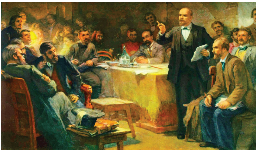
Ю.Е. Виноградов, «Выступление В.И. Ленина на II съезде РСДРП», 1952 год

Рано или поздно народ, будучи разочарованным грабительской политикой богачей, начинает выступать на улицах против произвола. Что будет, если коммунисты будут стоять в стороне и не поведут людей за собой? В таком случае недовольством народа воспользуются другие капиталисты, стремящиеся отнять национальные богатства у правящих буржуев в свою пользу. Как они это сделают? Действиями своих прислужников, буржуазных политических партий и движений, они, прикрываясь разговорами борьбы за социальную справедливость и за защиту прав народа, начнут вводить людей в заблуждение. После победы таких сил положение народа не улучшится, а возможно, и ухудшится. Произойдёт смена лиц во власти без смены самой системы эксплуатации и угнетения.