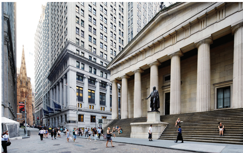
Уолл-стрит, Нью-Йорк, США, наши дни

Часто можно встретить точку зрения, что всё, что было написано Марксом и Энгельсом, было справедливо для капитализма полуторавековой давности. Обычно за такими рассуждениями следует, что капитализм, дескать, изменился и теперь он стал более гуманным, цивилизованным. Увы, это далеко не так: капитализм просто лучше научился маскировать свои наиболее отвратительные черты, суть же его не только не изменилась, а во многом стала ещё более зловещей. В наши дни комплекс социально-экономических проблем в России и в мире достиг таких огромных масштабов, что даже самые ярые апологеты капитализма не могут закрывать на них глаза. Однако они, признавая факт наличия трудностей, пытаются доказать, будто они обусловлены не системой как таковой, а неумелыми действиями отдельных руководителей. А в чём причина кризисных явлений?