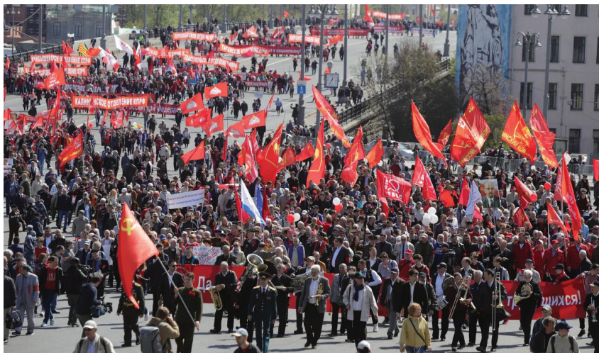
Массовое шествие КПРФ в Москве

Капитал делает всё от него зависящее, чтобы не допустить передачи власти трудовому народу. В этой связи даже в самой демократической по форме буржуазной республике власть использует все мыслимые методы, ухищрения и лазейки, направленные на подавление трудящихся. Трудовой народ по большей части отстранён от реального влияния на политические процессы. Правят бал только противоборствующие между собой кланы капиталистов. Информационные провокации против оппозиции, воспрепятствование её деятельности, манипулирование избирательным процессом, — всё это направлено на закрепление доминирующего положения олигархии. Более того, существует огромная степень вероятности аннулирования результатов выборов в случае победы на них представителей Коммунистической партии (как это было, например, в Приморье в 2018 г.).