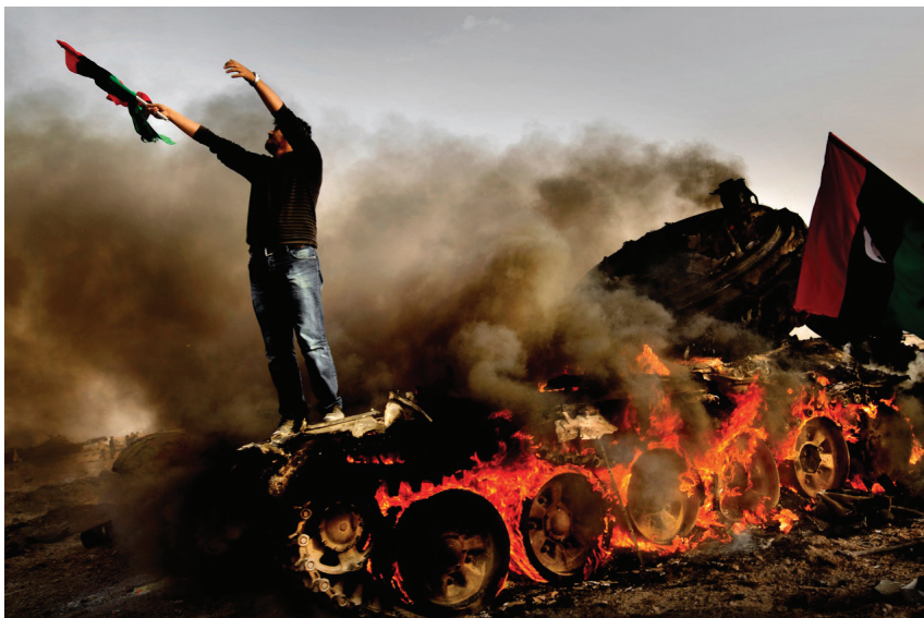
«Цветная революция» в Ливии привела к гражданской войне и распаду государства

Как империалистическим державам удаётся установить контроль над целыми регионами планеты? Путём развязывания захватнических войн либо инспирирования «цветных переворотов», в результате которых мировая буржуазия, используя в своих целях трудности той или иной страны, помогает захватить власть лояльным ей политическим силам. Начиная со второй половины XX века большая часть военных конфликтов происходила при прямом или косвенном участии США — главной империалистической державы мира.