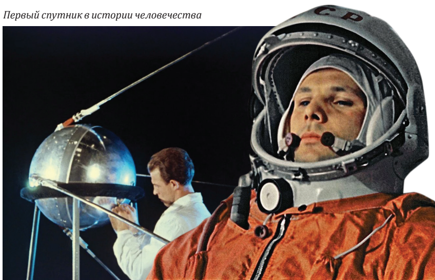
Первый в мире космонавт Юрий Гагарин

Успехи послевоенного СССР хорошо известны: открытие космической эры для всего человечества (запуск первого искусственного спутника Земли и первый в мире космический полёт советского гражданина — коммуниста Юрия Алексеевича Гагарина), создание первой в мире атомной электростанции в Обнинске и огромные социальные гарантии, обеспечивающие достойную жизнь и уверенность в будущем для всех граждан.