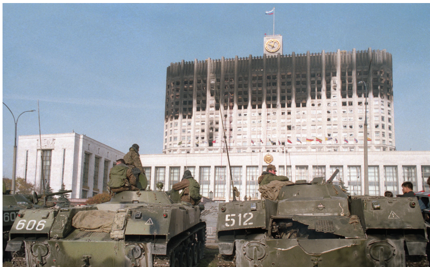
Для разгона депутатов Верховного Совета Ельцин бросил в бой танки

борьбу и добиваться лишь возрастания государственного участия в экономическом развитии и организации справедливого распределения ресурсов? Нет. Почему? Потому что государство в обществе, разделённом на классы, представляет собой не некоего арбитра, призванного примирить все социальные слои населения, а организацию господствующего класса, деятельность которого направлена на подавление сопротивления класса угнетаемого. Государство при капитализме — это орудие буржуазии для защиты своего господства. Эта функция первична, а все остальные (поддержание правопорядка, помощь беспризорникам, инвалидам, пенсионерам и т. п.) — вторичны.