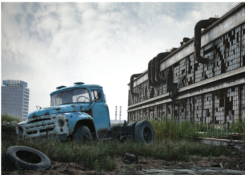
Развалины автомобильного гиганта «ЗИЛ», Москва, наши дни

В результате «рыночных реформ» Россия превратилась в источник сырья и рынок сбыта готовой продукции. Основа экономики — экспорт энергоносителей и других невозполнимых природных ресурсов. Произошла деиндустриализация — большая часть советского промышленного потенциала оказалась утрачена. Огромной стала зависимость от импорта товаров и капитала. Наблюдается свёртывание социальных программ. Обостряются и демографические проблемы — население вымирает.