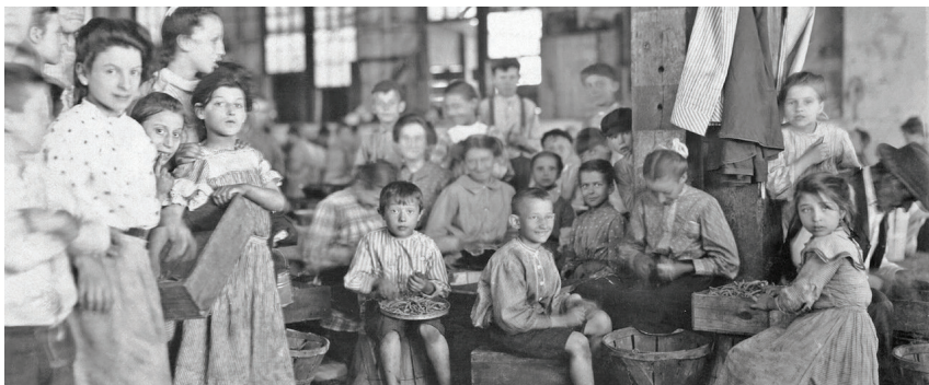
Дети на упоковочной фабрике. Балтимор, Мэриленд, 1909 год

Как положить конец подобному несправедливому положению вещей? Только путём перехода к новой общественно-экономической формации, базирующейся на общественной собственности на средства производства, на планировании экономического развития, на диктатуре пролетариата 3 , можно освободить трудящихся от эксплуатации и грабежа. Имеются ли предпосылки для замены капитализма социализмом? Да, всё развитие процессов в экономике неизбежно ведёт к подобному результату.