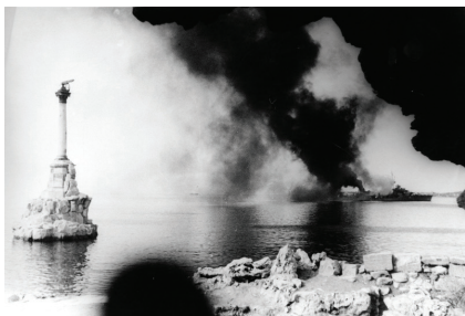
Севастополь в годы ВОВ

Война началась ровно через десять лет. К этому моменту социалистическая экономика СССР смогла создать 9 тыс. самых современных крупных предприятий. Промышленное производство по всем ключевым отраслям возросло по сравнению с 1913 годом от 3 (производство цемента) до 24 раз (производство электроэнергии). Начало Великой Отечественной войны СССР встретил лучшими образцами танков, самолётов, артиллерии и стрелкового вооружения. Победа далась советскому народу дорогой ценой — 27 млн. лучших сынов и дочерей нашего Отечества погибли на фронтах, от бомбёжек или были замучены в нацистских концлагерях. Было утрачено около 1/3 национального богатства.