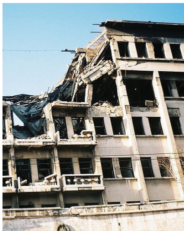
Последствия бомбардировок Югославии, 1999 год

еся эксплуатируемых стран, но и представители национальной буржуазии. Почему? Они стремятся вытеснить иностранный капитал либо компрадорскую буржуазию (т. е. национальную буржуазию, готовую продаться иностранному капиталу). В дальнейшем, отгородившись от зарубежных конкурентов, национальные капиталисты получают возможность самим эксплуатировать трудовой народ. Что в этой связи можно ожидать от их политических представителей? Попыток выхолостить классовую сущность национально-освободительной борьбы, придать ей реакционный шовинистический оттенок.