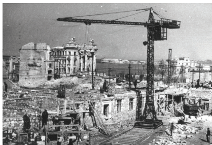
Восстановление Севастополя 1948-1949 гг.

Несмотря на огромные потери, СССР стал первой страной из всех стран — участниц Второй мировой, которая смогла восстановить разрушенную войной экономику и отменить карточки на продукты питания. Параллельно с этим активно развивался атомный проект, поскольку бывшие союзники по антигитлеровской коалиции обернулись против первого в мире социалистического государства. Уже через год после окончания войны в 1946 г. в своей знаменитой фултонской речи экс-премьер Великобритании Уинстон Черчилль призвал западный мир воздвигнуть между «западными демократиями» и СССР железный занавес. Параллельно США разрабатывали планы атомных ударов по городам Советского Союза. Только успешное испытание в 1949 г. первого советского ядерного устройства поумерило пыл ястребов империализма.