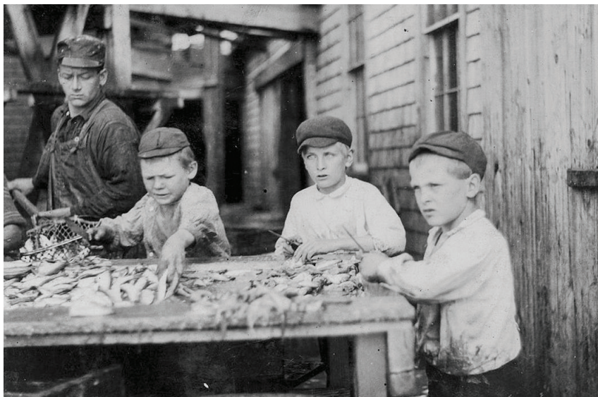
Дети за работой на рыбозаводе, США, начало XX века