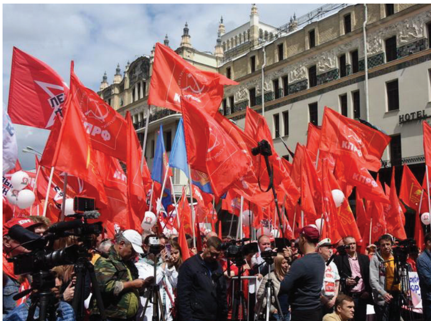
Акция протеста КПРФ, 2019 год

частной собственности. Эти направления предлагают заменить отдельные лица во власти, не подвергая угрозе саму систему капитализма — корень всех бед и зол. Как правило, многообразие партий и движений служит при капитализме для выражения интересов разных группировок олигархов, соперничающих за власть над народом различных объединений банкиров, промышленников, всевозможных магнатов и т. п. Но их общая антинародная суть остаётся неизменной. Задача буржуазных партий и движений — изменять баланс сил внутри системы, чтобы получить большую долю при дележе награбленных у народа богатств, но при этом сохранить основы этой системы, при которой грабёж в принципе возможен. Единственная последовательная сила, которая не готова ограничиться полумерами и добивается прекращения всякого ограбления трудящихся капиталистами, действительно желает коренных перемен в обществе, — это коммунисты.