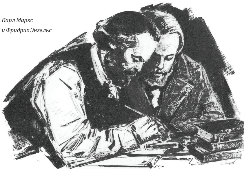
Карл Маркс и Фридрих Энгельс

Поэтому, когда буржуазные идеологи пытаются убедить общество, что пролетариат, дескать, «уже не тот» или его «вообще уже не существует» (вот как!) — это не более чем примитивные уловки для того, чтобы запутать неискующего слушателя.