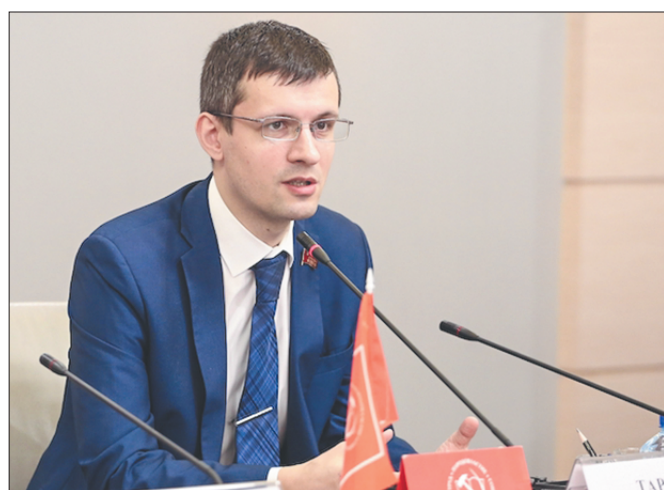
Стр. 2 – Как оказаться экстремистом