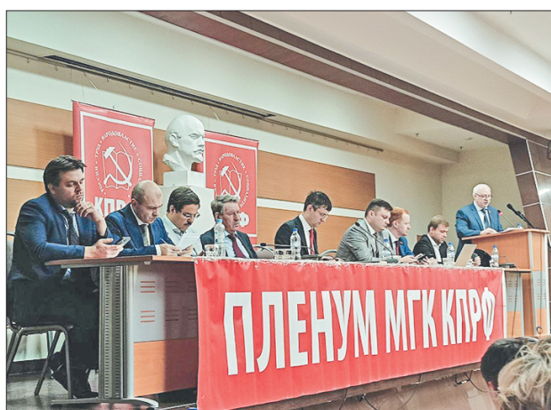
Стр. 3 – КПРФ — за сильную экономику и промышленность!