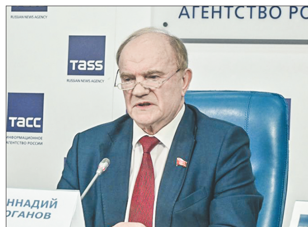
Стр. 8 – Учиться, учиться и ещё раз учиться!