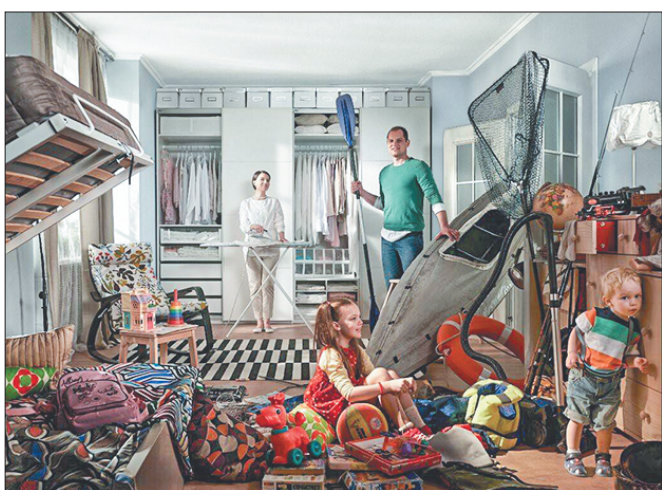
Стр. 4 – В тесноте да... сколько можно!