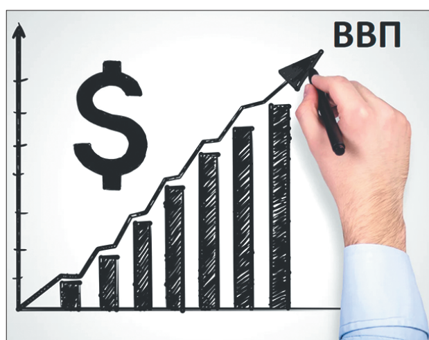
Стр. 4 – Рост ВВП: радоваться ли?