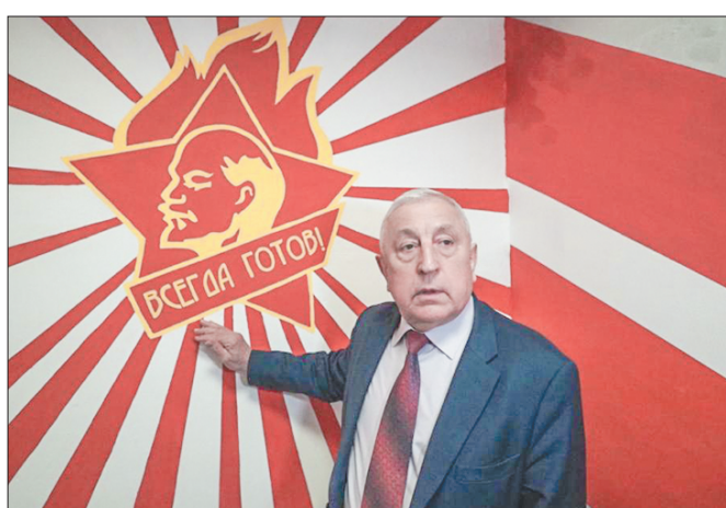
Стр. 2 – Николай Харитонов посетил Екатеринбург