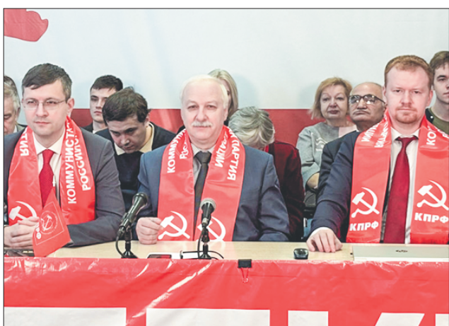
Стр. 2 – Коммунисты – на переднем крае борьбы с фашизмом