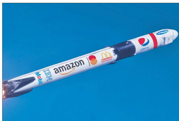
Стр. 7 – Юра, прости нас...