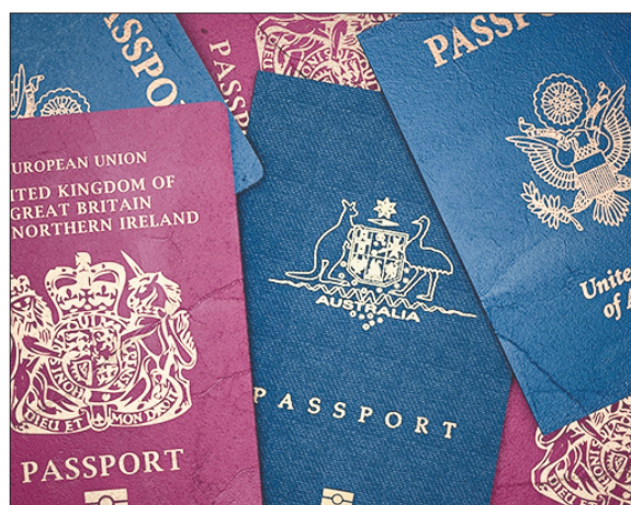
Стр. 4 – Коллекция паспортов для олигарха