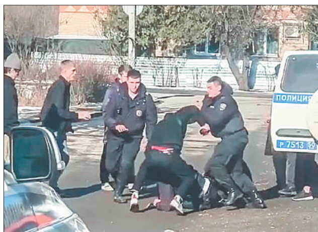
Стр. 7 – Обнулить всё