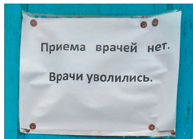
Стр. 8 – Почему врачей всё меньше?