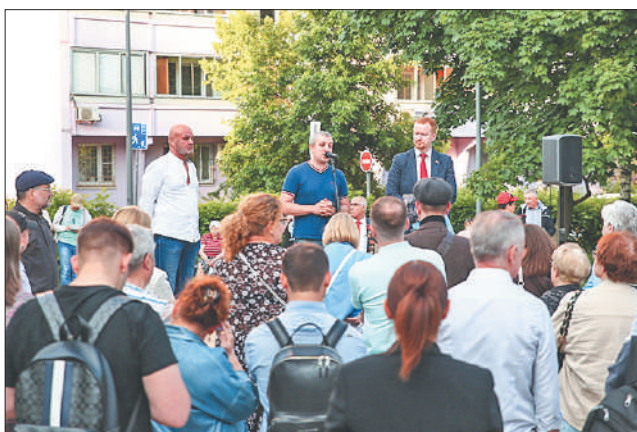
Стр. 2 – Очаково-Матвеевское: реновация с привкусом химии