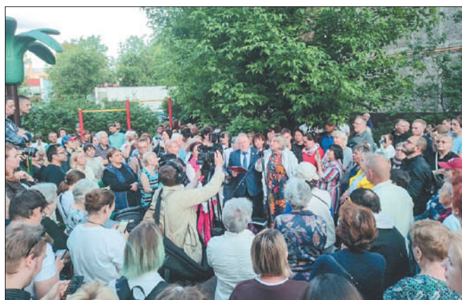
Стр. 2 – Бабушкинский парк: революцию пережил, реновацию – нет