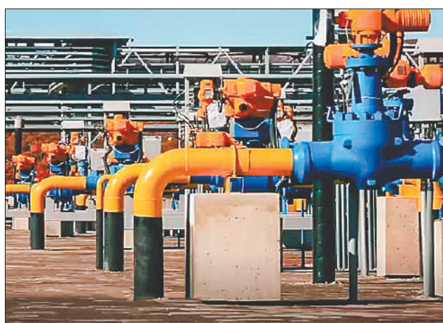
Стр. 6 – Россия – щедрая душа!