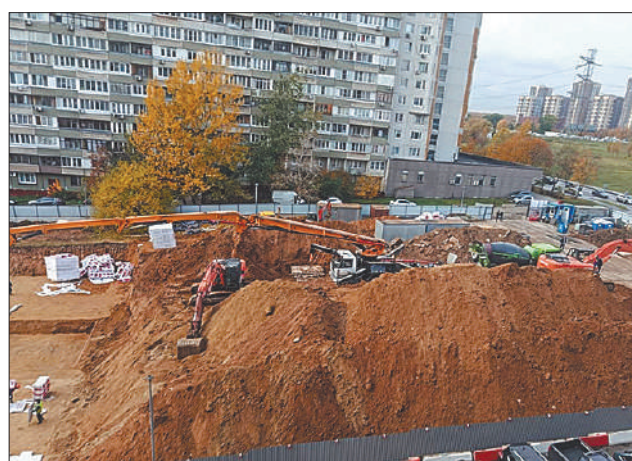
Стр. 3 – Бутово в плену у стройки