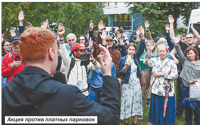
Акция против платных парковок

Этот вопрос серьёзно беспокоит москвичей. В Государственной Думе жители сразу 15 столичных районов при поддержке депутатов провели круглый стол по проблеме разрастающейся эпидемии платных парковок в столице. Одна из основных тем – вопрос о необходимости обсуждения с жителями введения платных парковок и учёта их мнения. Люди хотят участвовать в решениях, которые напрямую влияют на их жизнь. Сейчас