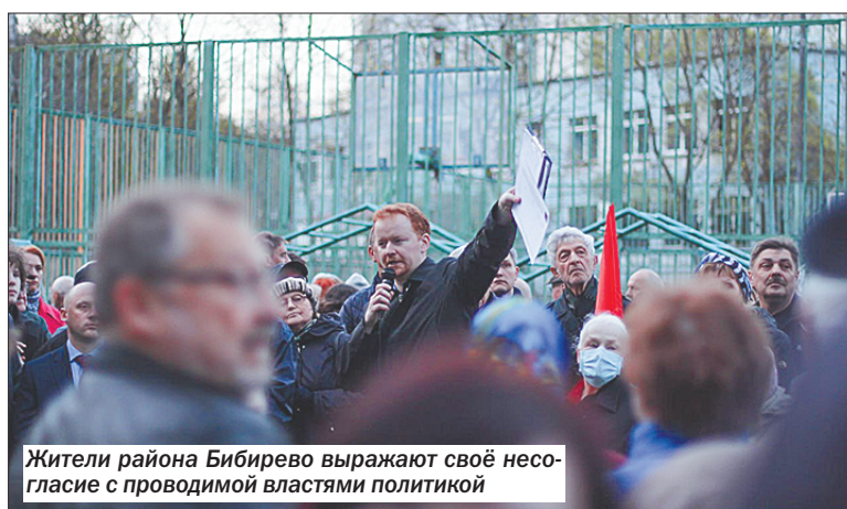
Жители района Бибирево выражают своё несогласие с проводимой властями политикой

А ведь парковка – это ещё и ловушка с штрафами. Далеко не везде есть паркоматы, а мобильный интернет часто работает с перебоями. На оформление дают 5 минут – и если вы чуть опоздали, штраф – 5 000 рублей. Это во много раз больше стоимости парковки. Для орга-