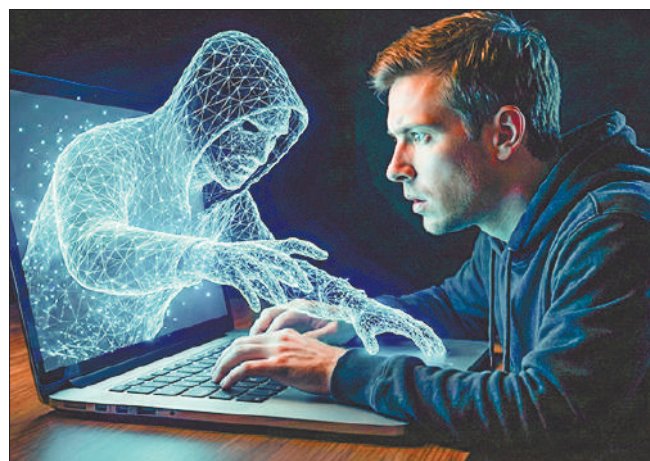
Стр. 7 – Рост в эпоху спада