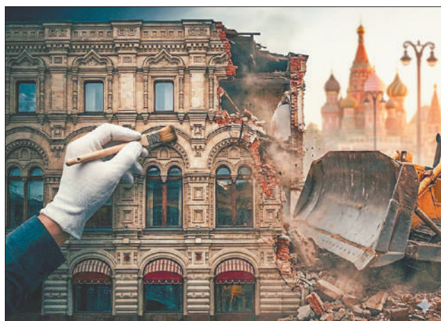
Стр. 3 – Как Москва теряет прошлое